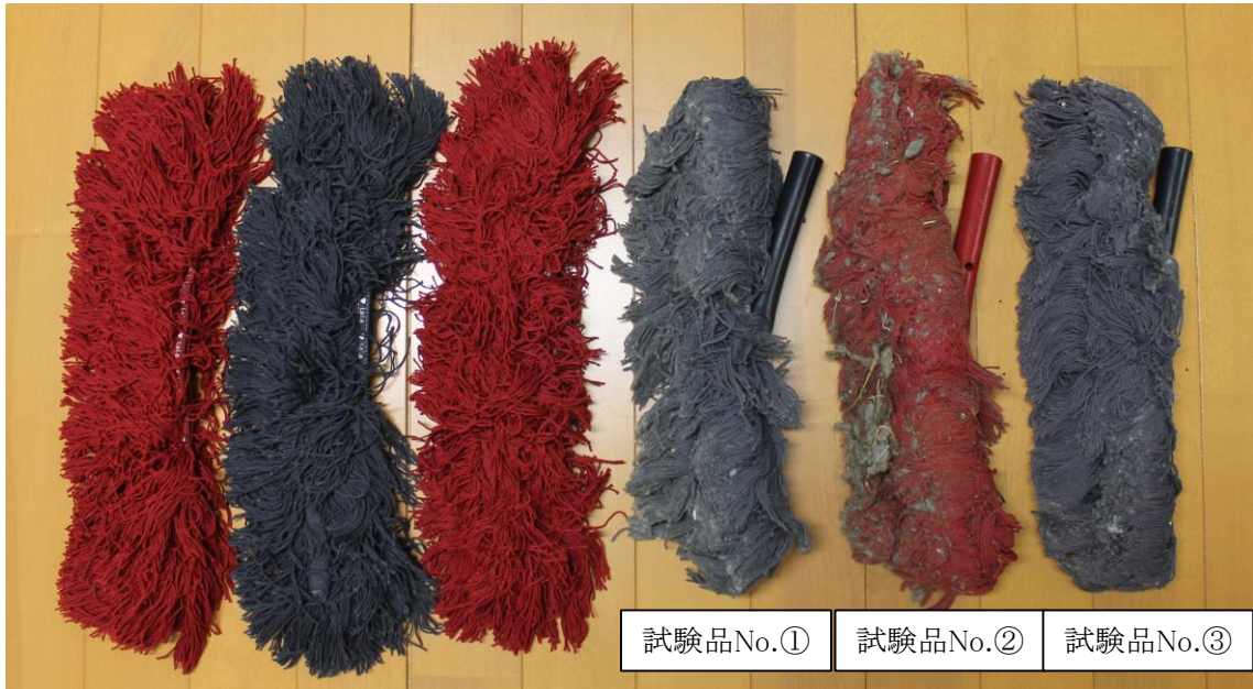
写真. 試験で使したモップ