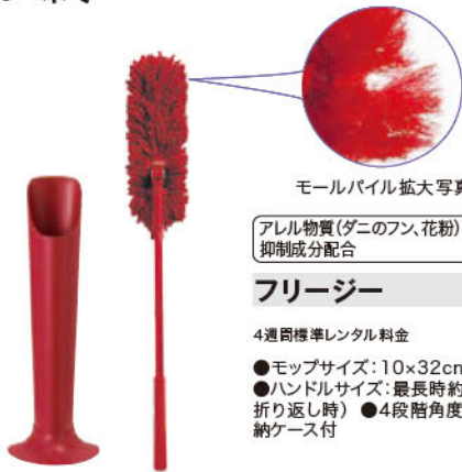
モールパイル拡大写真