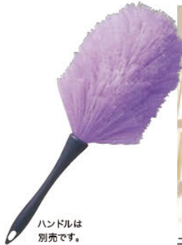
ハンドルは別売です。