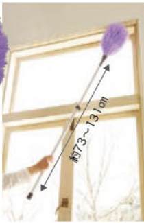
ニューエレクトロン伸縮ハンドル